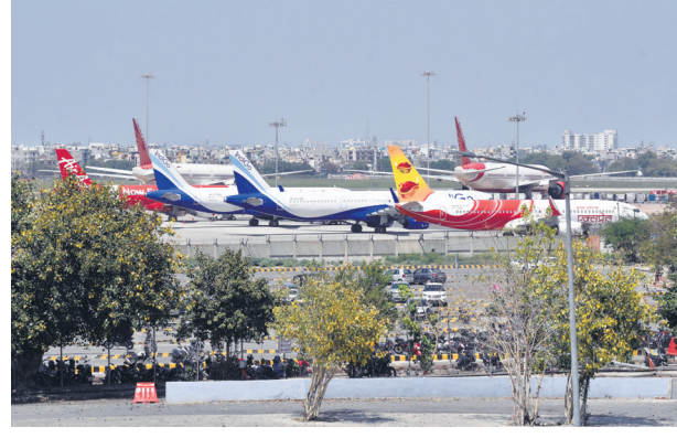
Most carriers plan to gradually increase capacity to 60% of precovid levels only by Diwali, which falls in November this year. нт

orate General of Civil Aviation (DGCA) showed domestic air traffic in July grew to 2.1 million, slightly more than June's 1.98 million passengers.